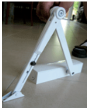
Dörrstängare med stopp 950 kr Passar till utåtgående dörrar.