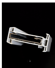
Skarvregel 350 kr/m 27 mm stålregel med ett yttre hölje av PVC.