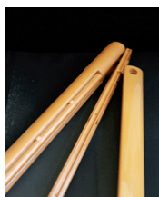
Ljusbrun spaltventil 430kr EMM-787. Ral nr 8001