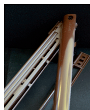
Chokladbrun spaltventil 430kr EMM-747. Ral nr 8017