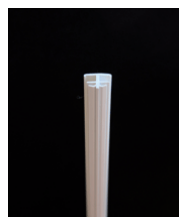
Skarvlist 70 kr/m 2 mm h-list i PVC, skarvar på insida och utsida