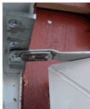
Friktionsbroms 190 kr Passar till utåtgående dörrar.